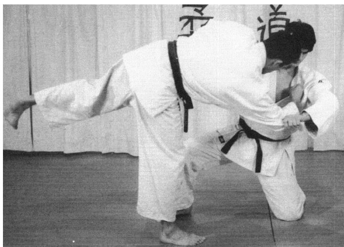
Uki-otoshi Płynne obalenie